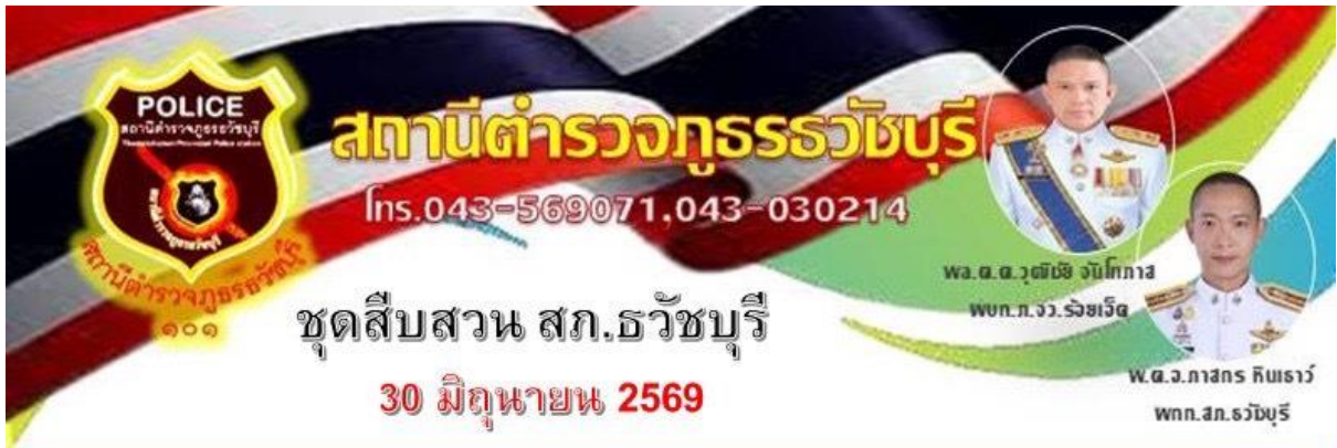
ภาพ ผดท.ที่ 1 - 12